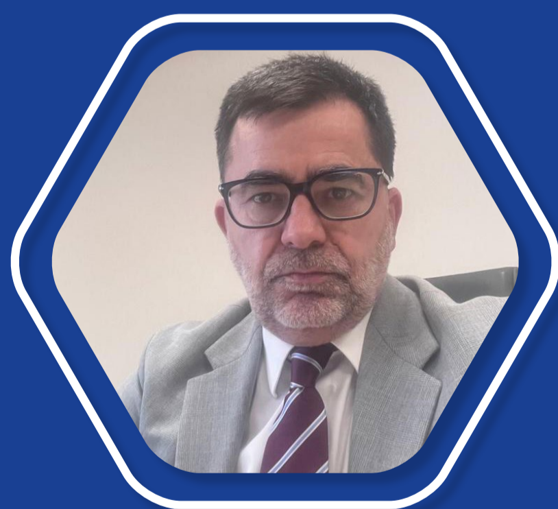
IACOPO BERTI Capo Dipartimento per la tutela del consumatore AGCM